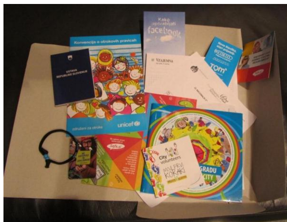
Gradivo, ki so ga prejeli udeleženci otroškega parlamenta