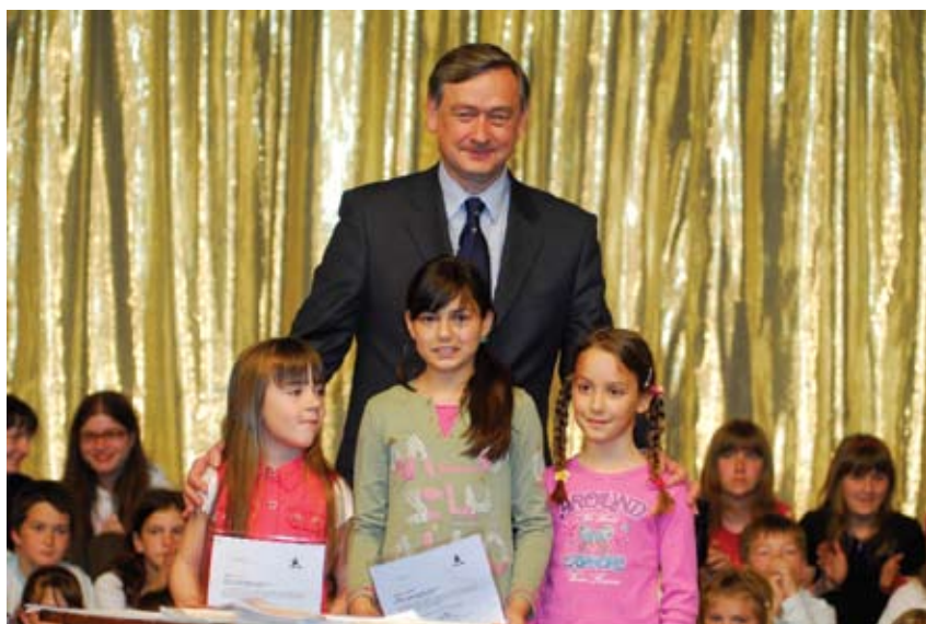
Predsednik RS dr. Danilo Türk z najmlajšimi nagrajenci.