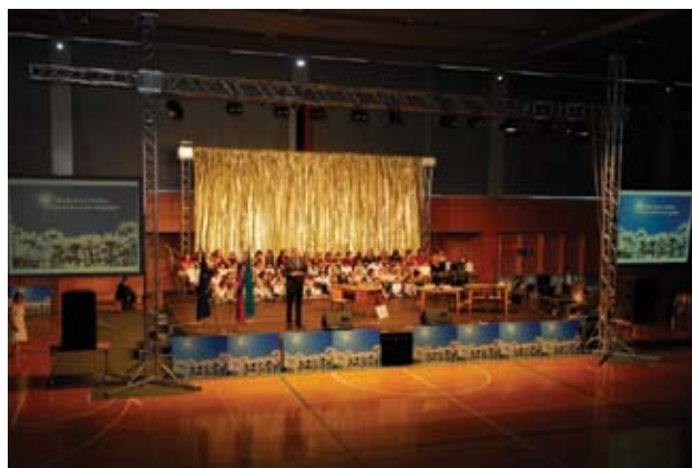
Slike z zaključne prireditve v Novi Gorici, 9. maj 2008.